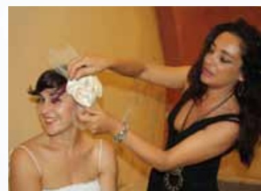
Los tocados de la pintora y diseñadora, también protagonistas